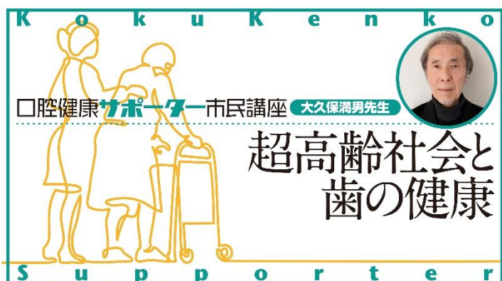
画像左 市民講座のタイトル画面

株式会社ロッテは一般社団法人「口の健康と食べる力を支える会」の理念に賛同し、活動に協力しています。この度、本会ホームページ ( https://kuchinokenko.org/ ) にて「口腔健康サポーター市民講座」の公開を2023年3月17日(金) 10時より開始することをお知らせいたします。なお、会員登録をしていたことで、生涯を通しての口の健康、食べる力の重要性、全身の健康との関係性などの動画を、どなたでもすべて無料でご覧いただけます。