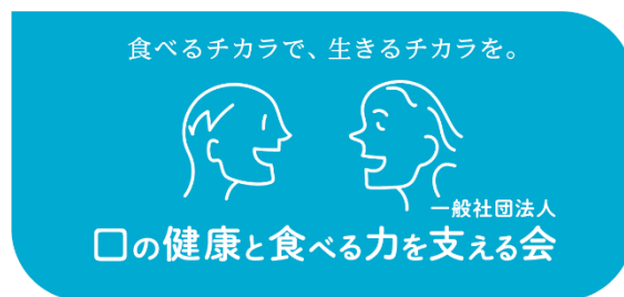
画像右 本会のロゴマークと口腔健康サポーターのロゴマーク