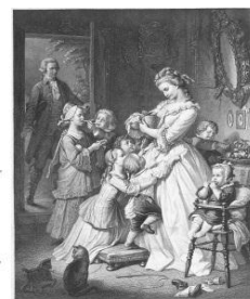
社名の由来である “若きウェルテルの悩み”のヒロイン 「シャルロッテ」